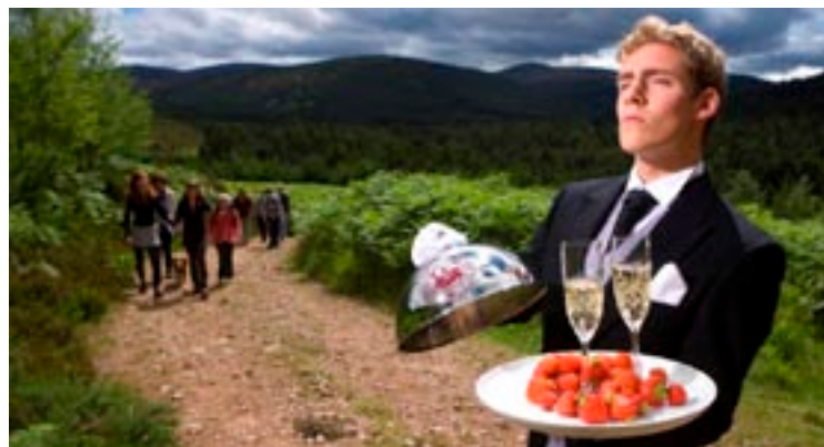
Eine Veranstaltung zum Thema „Essen und Spazieren gehen“ ist Schwerpunkt des „Food Tourism Projects“.

tes Projekt der LAG Rural Aberdeenshire nennt sich „A Mearns Heritage: 1980 – 2013“. In diesem Projekt werden das kulturelle Erbe und die jüngste Geschichte von Mearns, einer stark landwirtschaftlichen Region in Aberdeenshire, durchleuchtet – unter Berücksichtigung der lokalen, nationalen und internationalen Ereignisse, die die Entwicklung der Region geprägt haben. Ein eigens angestellter Projektmanager wird in mehr als zwei Jahren gemeinsam mit Erwachsenen mit Lernschwäche, die im Rahmen des Projektes in verschiedenen Initiativen beschäftigt werden, sowie in Zusammenarbeit mit Schulen und Büchereien eine Veranstaltungs- und Ausstellungsreihe organisieren, die die Geschichte von Mearns in den letzten 30 Jahren erzählt. Der Projektträger, das „Forest View Centre“ der Region Mearns, erhielt für dieses Projekt