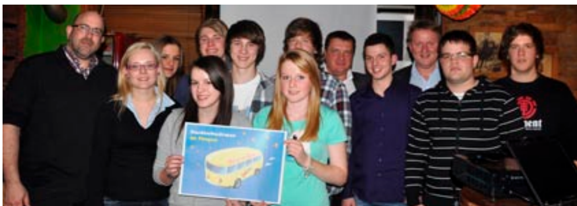
Jugendstil in der Verkehrsplanung.

Seit mehreren Jahren finanziert der Regionalverband Pongau das bestehende Nachtbusssystem „Pongauer Nachschwärmer“. Man ist aber zunehmend unzufriedener mit dem bestehenden System, weshalb eine Neuplanung für ein modernes Nachschwärmer-System unweigerlich auf der „to-do-Liste“ steht.