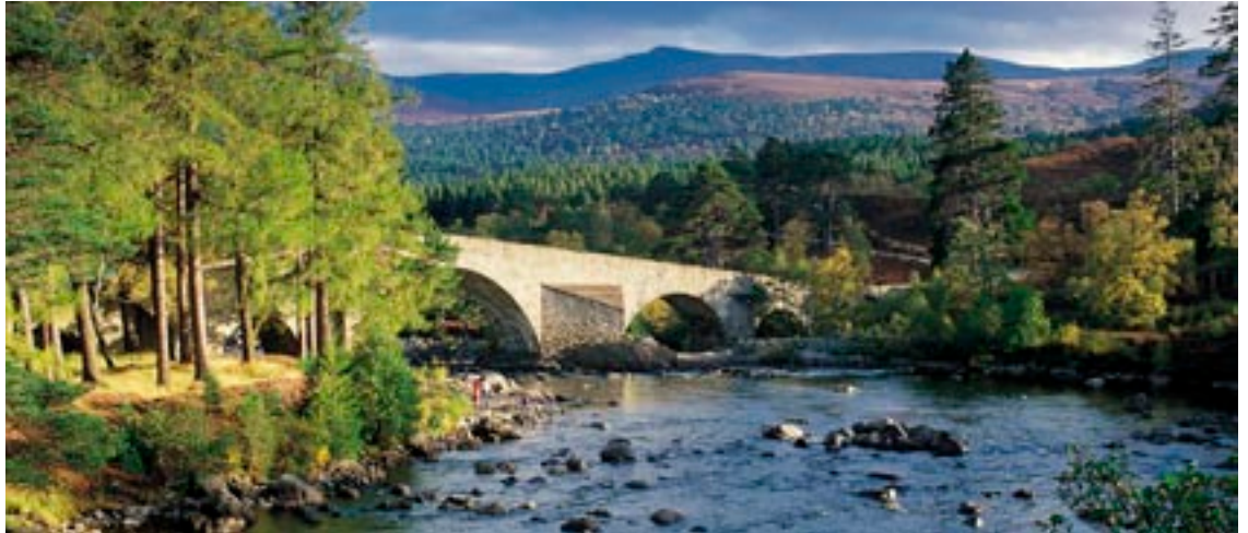
Rural Aberdeenshire in Schottland.

Was tut sich eigentlich in der ländlichen Entwicklung anderorts in Europa? Welche Projekte werden dort umgesetzt, welche Fördersummen lukriert? Wir beantworten diese und andere Fragen in unserer neuen Serie, wenden als erstes den Blick nach Schottland und stellen hier die LAG Rural Aberdeenshire vor.