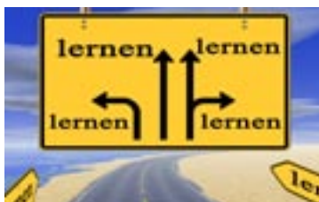
Frauen lernen u.a. sich im Social Web zu bewegen.

Die Halbzeitbewertung des Programms für die Ländliche Entwicklung LE 07-13, aus dem Projekte in den Regionen entwickelt und finanziert werden, zeigt auf: Bei Kommunikation und Information des Programms spielt Chancengleichheit bisher eine geringe Rolle.