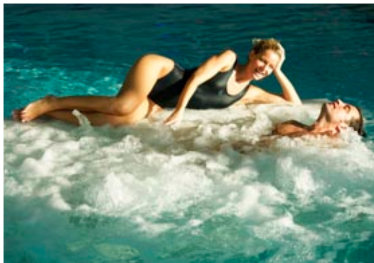
Die Erlebnisbäder und Thermen im Pongau laden zum Entspannen ein.

Öffnungszeiten: SO bis DO von 09:00 - 22:00 Uhr, FR und SA bis 23:00 Uhr